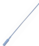
CHIAVE REGOLAZIONE FINE CORSA END LIMIT ADJUSTMENT TOOL