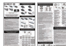
FOGLIO ISTRUZIONI INSTRUCTION LEAFLETS