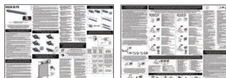
FOGLIO ISTRUZIONI INSTRUCTION LEAFLETS