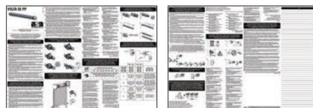
FOGLIO ISTRUZIONI INSTRUCTION LEAFLETS