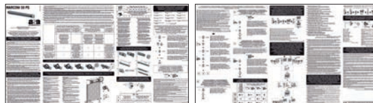
FOGLIO ISTRUZIONI INSTRUCTION LEAFLETS