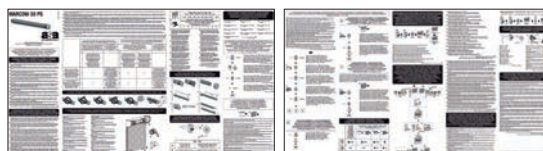
FOGLIO ISTRUZIONI INSTRUCTION LEAFLETS